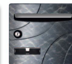
300 gris médium