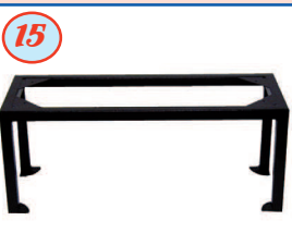
15 Chaise (Hauteur 400 ou 750 mm)