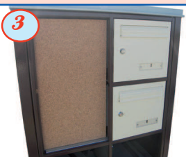
3 Tableau d'affichage (bois) sans porte - 1,2 ou 4 alvéoles