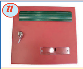
11 Volet et portillon de teinte différente (selon nuancier)