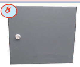
8 Portillon intégral (sans fente d'introduction)