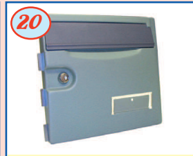
20 Portillon EPSILON Extérieur (traité par catharèse)