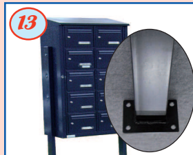
13 Poteau 80x40 mm sur platine, à visser (boulonnerie fournie)