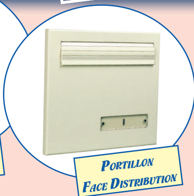
PORTILLON FACE DISTRIBUTION