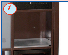
1 Alvéole vide (sans portillon)