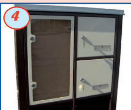
4 Tableau d'affichage (bois) avec porte - 1,2 ou 4 alvéoles