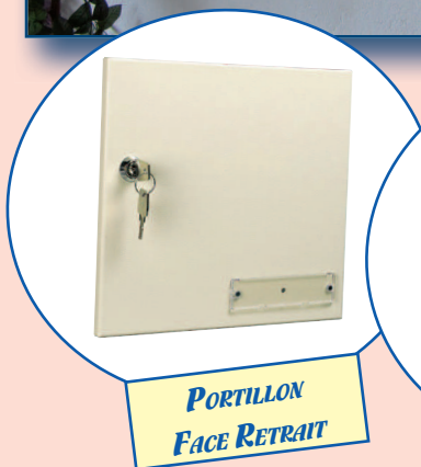
PORTILLON FACE RETRAIT