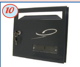
10 Portillon avec logo personnalisé découpé