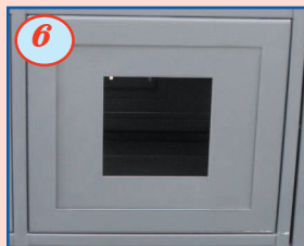
6 Réservation interphonie 1 ou 2 alvéoles verticales