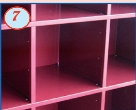
7 Intérieur peint (de la couleur du coffre)