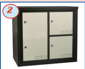
2 Alvéole double hauteur avec porte (courrier volumineux)