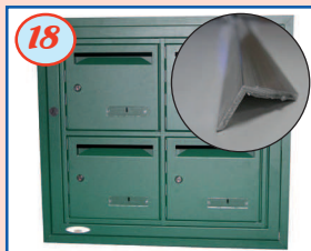
18 Profil d'encastrement (cornière)