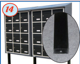
14 Poteau 80x40 mm à sceller (boulonnerie fournie)