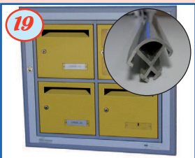
19 Profil d'encastrement (1/4 de rond)