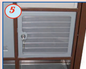
5 Tableau nominatif à réglette avec porte - 1,2 ou 4 alvéoles