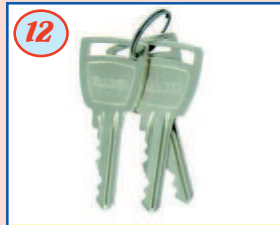
12 3ème Clé sur portillon